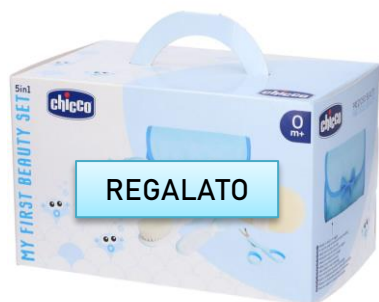
Beauty 5 in 1 chicco €22,90