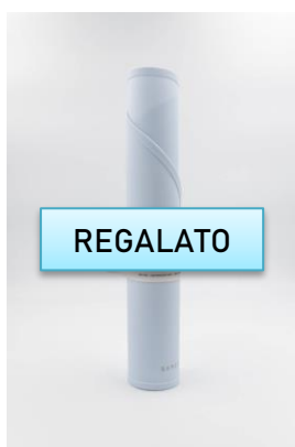
Sottopiatto bamboom €10,00