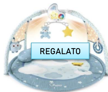
Enjoy colours gym €59,90