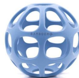
Massaggiagengive palla €17,00