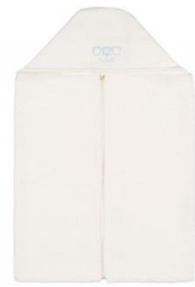
Accappatoio nanan €59,00