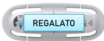
Antiabbandono cybex €59,90