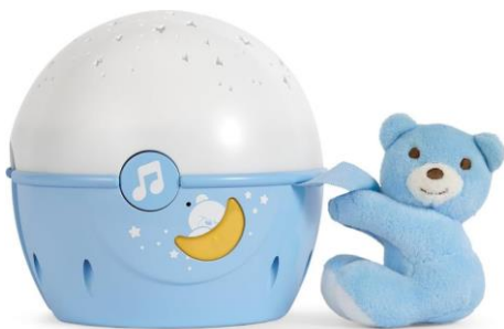
First dream next 2 stars €32,90