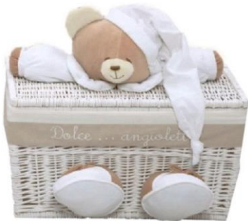
Baule nanan medio €169,00