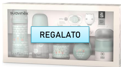
Set bottiglie €41,00