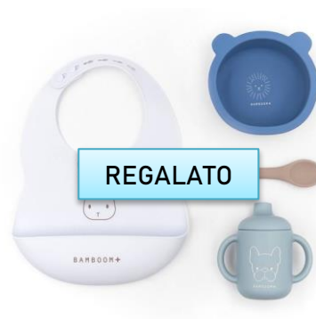
Set pappa bamboom €35,00