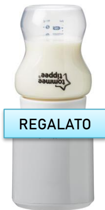
Scaldabiberon tommee tippee €70,00