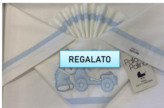
Set lenzuoline navetta €24,00