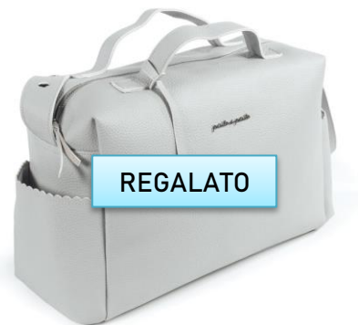
Borsa Pasito €80,00