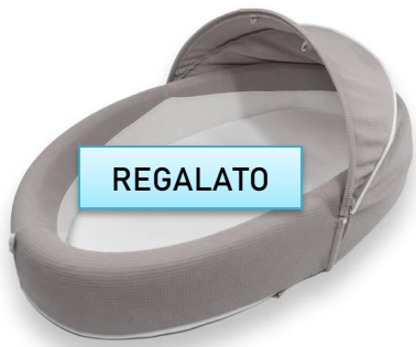
Bamboom Baby nest €120,00