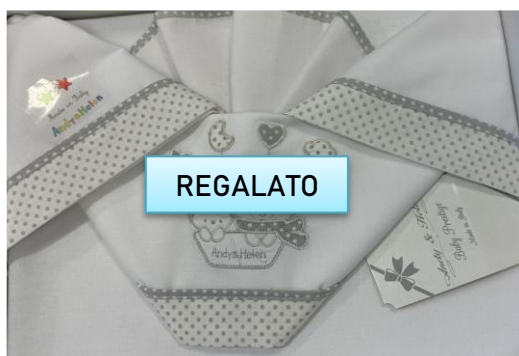
Set lenzuoline navetta €24,00