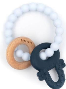
Massaggiagengive bracciale €13,00