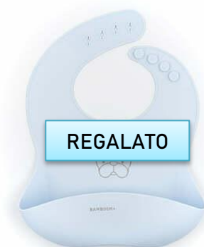
Bavetta bamboom €10,90