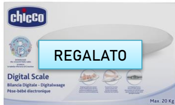
Bilancia chicco €54,90