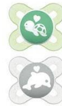
Ciucci mam 0-2 mesi €10,90