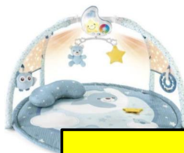
Enjoy colours gym €59,90