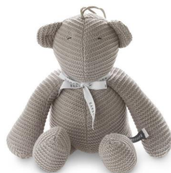
Carillon bamboom grigio €32,00