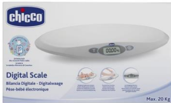
Bilancia chicco €54,90