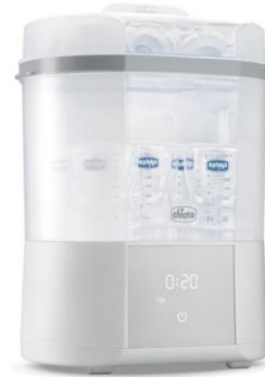
Sterilizzatore con asciugatura €75,00