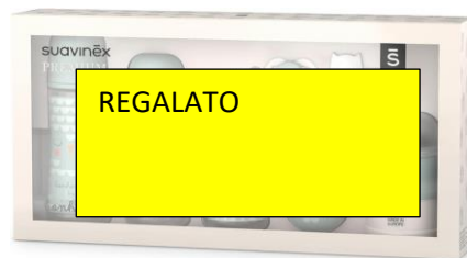
Set bottiglie €41,00