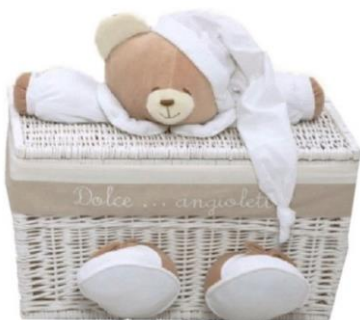
Baule nanan medio €169,00