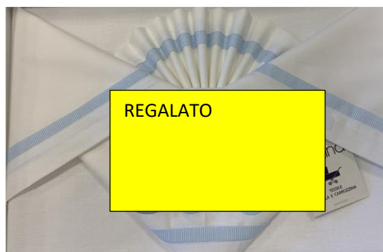
Set lenzuoline navetta €24,00