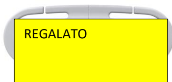
Antiabbandono cybex €59,90