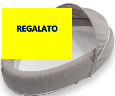
Bamboom Baby nest €120,00