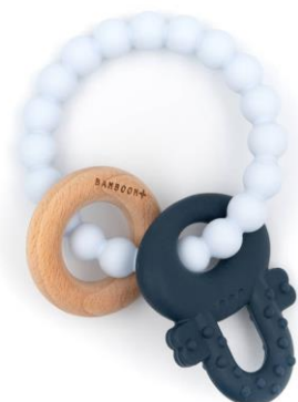
Massaggiagengive bracciale €13,00