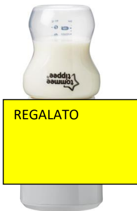
Scaldabiberon tommee tippee €70,00