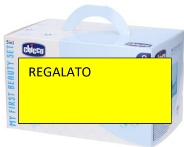
Beauty 5 in 1 chicco €22,90