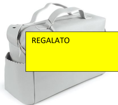
Borsa Pasito €80,00