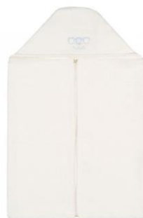
Accappatoio nanan €59,00