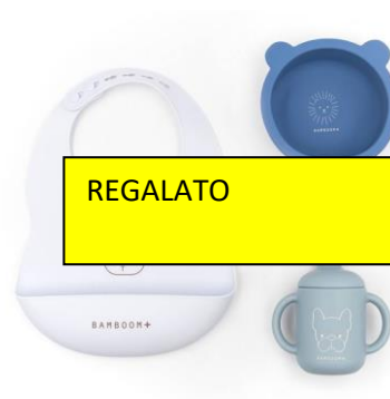
Set pappa bamboom €35,00