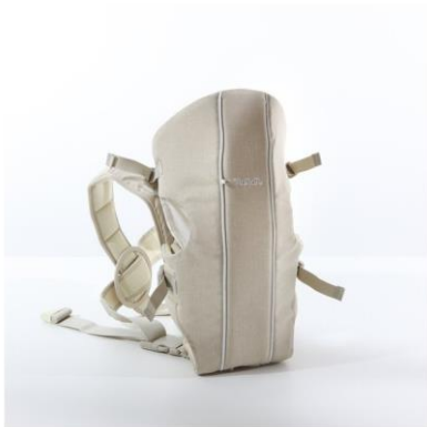
Marsupio nanan Tato €69,00