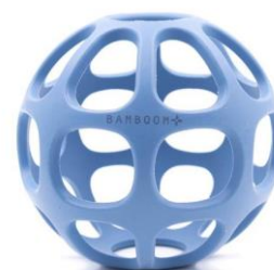
Massaggiagengive palla €17,00