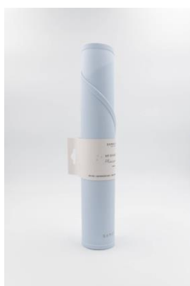
Sottopiatto bamboom €10,00