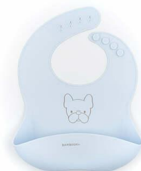
Bavetta bamboom €10,90