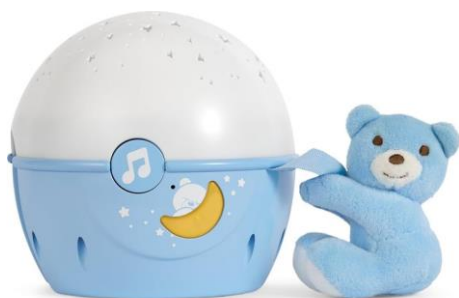
First dream next 2 stars €32,90